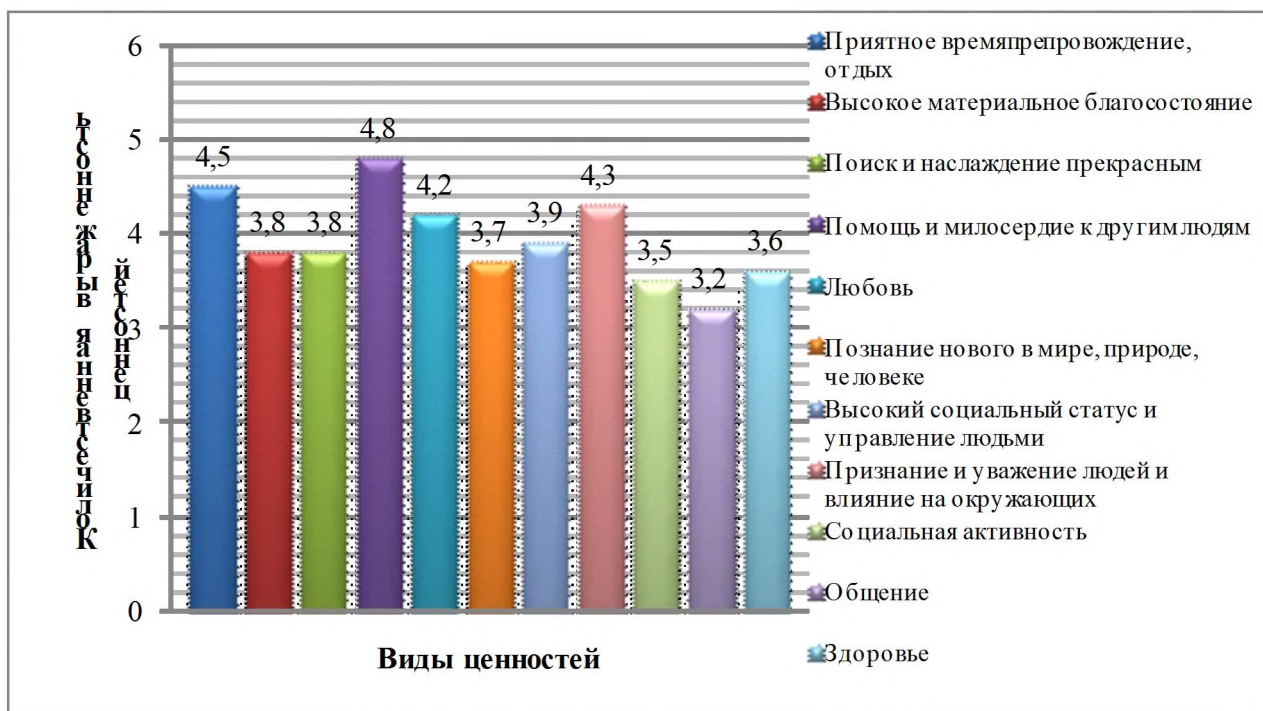
Рисунок 1 – Средние результаты диагностики реальной структуры ценностных ориентаций личности в выборке исследования

При анализе показателей личностной ориентации студентов всей выборки с ранжированием по группам и курсам отмечен отчет-