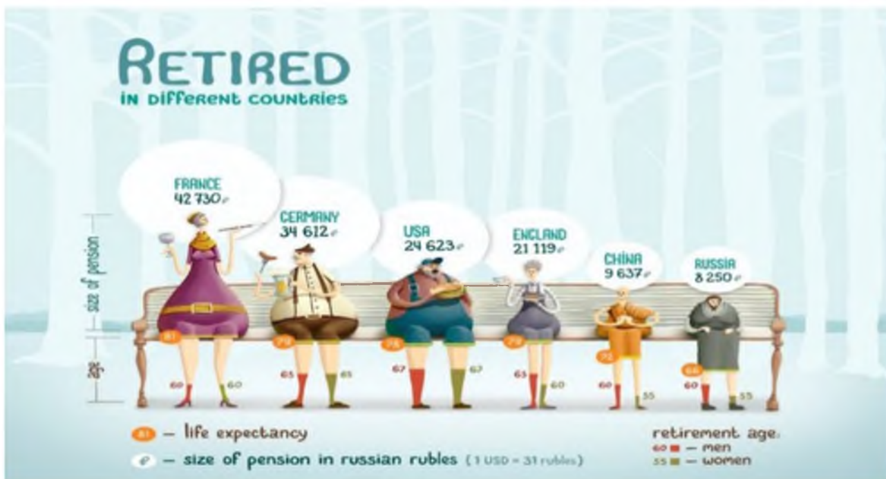
2 сурет – Басқа мемлекеттердегі зейнеткерлік жас [6]

Тапсырмалар лексика-грамматикалық дағдыларды арттыруға және оқу, сөйлеу және мәтінді оқып түсіну дағдыларын арттыруға бағытталуы керек.