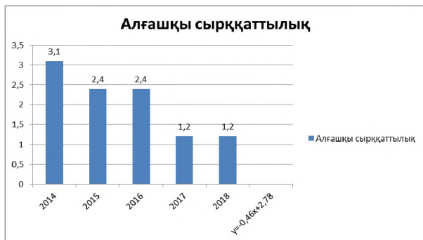
2 сурет – Қарағанды қаласының тұрғындары арасында артериялық гипертензиямен алғашқы аурушандық динамикасы (1000 адамға шаққанда)